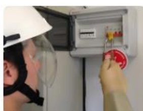
Habilitation haute tension