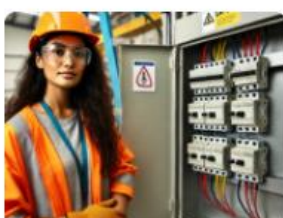
Habilitation basse tension