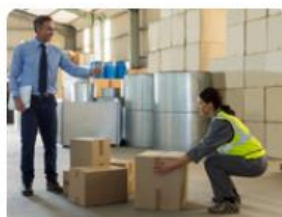
Gestes et postures