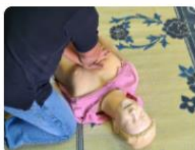
Sauveteur Secouriste du Travail recyclage