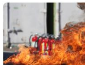
Lutte contre le feu