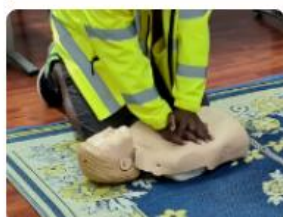
Sauveteur Secouriste du Travail initial