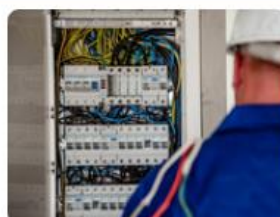
Habilitation non électricien (H0 B0)